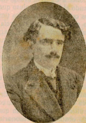
José María Eguren

Ha corrido ciertamente mucho tiempo desde cuando ese espíritu generoso e iluminado que se llamó Abraham Valdelomar, descubrió al gran poeta peruano José María Eguren, y, con palabras sibilinas que admirablemente se van cumpliendo, auguró en su revista "Colónida" el porvenir luminoso del artista.